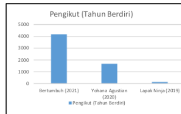
Gambar 1 : Grafik pertumbuhan pengikut Bertumbuh dengan perusahaan serupa

CV Momentum Bertumbuh Indonesia merupakan perusahaan yang bergerak dibidang jasa edukasi, konsultasi dan pelatihan dalam bisnis secara online yang didirikan pada bulan Maret tahun 2021 oleh Setyo Nugroho selaku founder dan Budi Gunardi selaku co-founder yang berlokasi di Surabaya. Dibandingkan dengan perusahaan dengan memberikan jasa yang serupa. CV Momentum Bertumbuh Indonesia mengalami pertumbuhan yang pesat dari awal tahun berdiri. Tujuan didirikannya perusahaan adalah untuk mendampingi, meningkatkan dan memotivasi untuk melakukan inovasi dalam berbisnis sehingga meminimalisir terjadinya kegagalan.