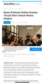
Gambar 2 : Perusahaan Bertumbuh masuk berita di jawapos.com

Seperti yang telah diliput dalam media online JawaPos.com pada tanggal 25 Januari 2022. Bertumbuh membantu pemula dalam memulai bisnis online dari mulai riset pasar sampai kebutuhan promosi. Pemberian layanan yang baik dengan cara melakukan pendekatan kepada konsumen yang dalam penelitian ini adalah member Momentum Bertumbuh Indonesia adalah salah satu cara untuk membangun hubungan baik dan pada akhirnya mampu memberikan kepuasan konsumen, disamping mampu mempertahankan konsumen yang sudah ada untuk selalu menggunakan atau membeli produk yang ditawarkan, perusahaan harus mampu untuk menarik calon konsumen baru untuk membeli produknya. Sebuah pelayanan yang optimal dapat mampu meningkatkan image perusahaan. Dengan memiliki citra yang positif, maka segala yang dilakukan oleh perusahaan akan dianggap baik pula.