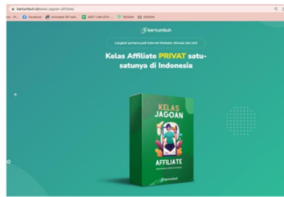
Gambar 4 : halaman website Bertumbuh Kelas Jagoan Affiliate

Dalam mewujudkan kualitas pelayanan yang berkualitas perusahaan wajib memberikan fasilitas yang sesuai dengan yang sudah ditawarkan kepada konsumen. Menurut keterangan informan yang mengetahui Bertumbuh dari iklan facebook, bahwa iklan tersebut menarik perhatian informan karena tampilannya yang menarik selain itu dari pihak perusahaan juga memberikan keterangan bahwa Bertumbuh membentuk team advertiser khusus untuk mempromosikan produknya.